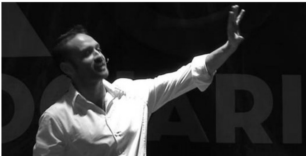
SANTINO CARAVELLA Cabarettista foggiano