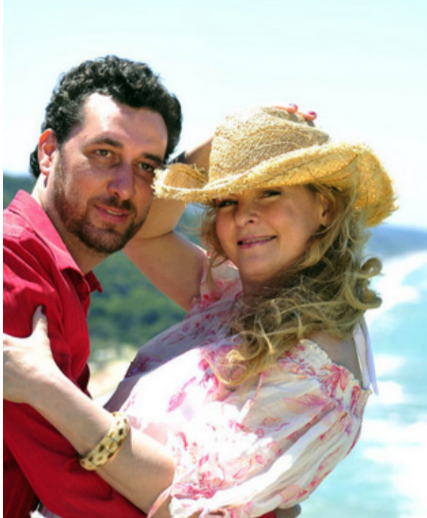
L'ex coppia famosa della Repubblica Ceca