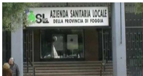
La sede di Piazza della Libertà